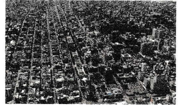
資料1 計画的につくられた都市

① 北海道開拓の中心地として計画的につくられた、資料1の都市はどこですか。(札幌市)