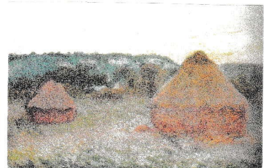
↑ 日暮れ. 秋