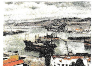
( アルビの港 / アルパール・マルケ )