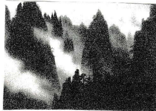
( 黄山雨過 / 東山野夷 )