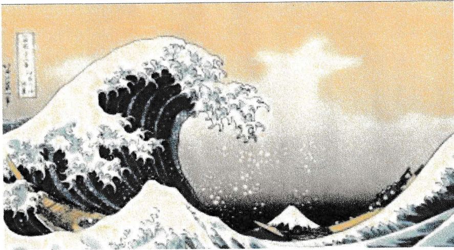
「 富士三十六景 」より 神奈川沖浪裏 (葛飾北斎作) ふしかく かながわおき 1831