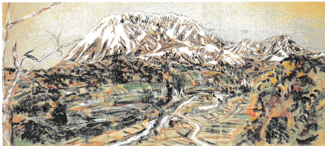
↑ 「大山」 水彩、紙 (小林知作作)